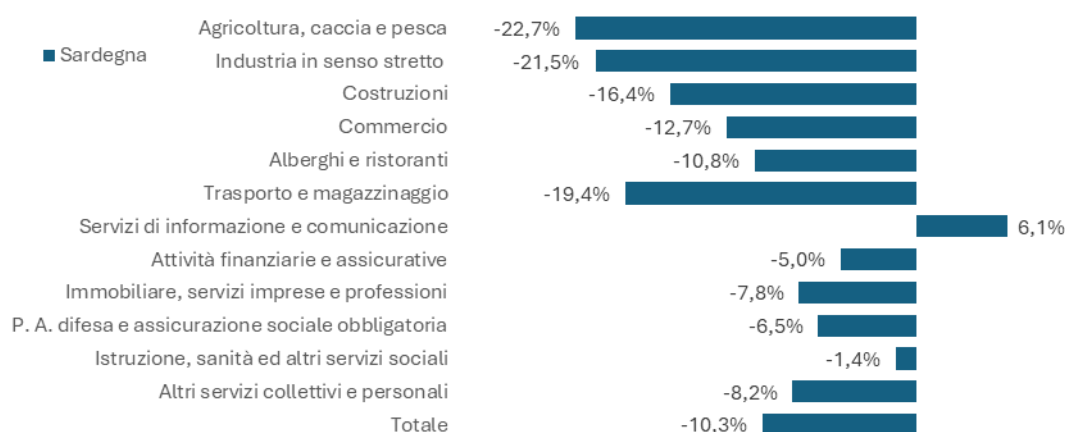
Figura 1 – Saldo occupazionale netto per settore di attività

digitalizzazione e all'innovazione tecnologica saranno motori di crescita occupazionale, come ITC, professioni ad alto valore aggiunto e attività finanziarie e assicurative.